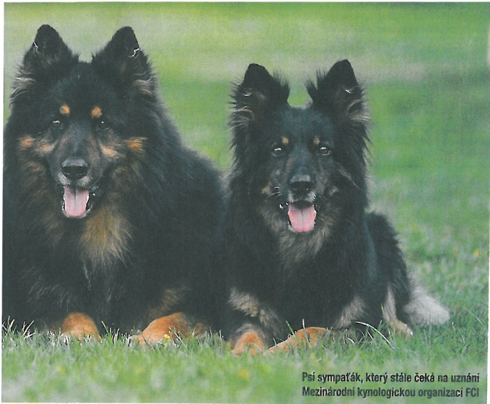
Psi sympáček, který stále čeká na uznání Mezinárodní kynologickou organizací FCI