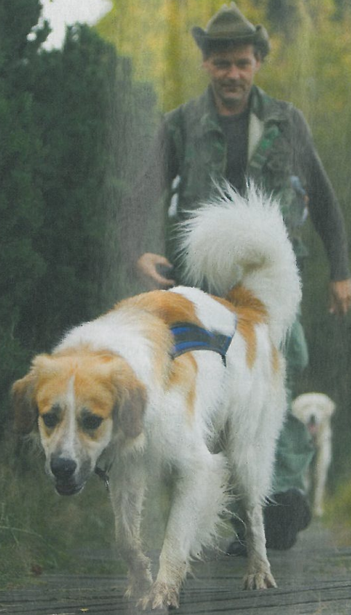
Český horský pes vznikl křížením slovenského čuvače s kanadským saňovým psem