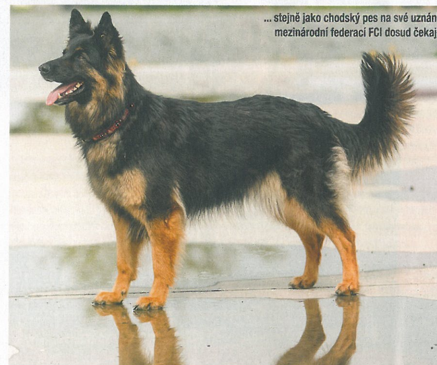
... stejně jako chodský pes na své uznání mezinárodní federací FCI dosud čekají

A která česká plemena jsou ta, jejichž chovatelské kluby zatím o uznání FCI ani nezažádaly? Velmi zajímavé a málo rozšířené je plemeno, které bylo nazvané po svém šlechtiteli – Horákův laboratorní pes. Opravdu, tyto strakáci byli zakladatelem plemene, profesorem Františkem Horákem, vyšlechtění v padesátých letech pro potřeby Fyziologického ústavu ČSAV jako ideál k laboratorním účelům. Aby byl v laboratoři co nejlépe použitelný, měl být klidný a mírný, nenáročný na péči a měl se snadno množit. Povedlo se, byl vyšlechtěn tvárný, snadno ovladatelný, neagresivní a snášenlivý psík. Naštěstí se tyto psi od roku 1980 v laboratořích přestali používat a vědci je předali chovatelům. Od té doby nesou jiný, důstojnější název – český strakatý pes – a též jejich osud není už tak černý, jak se dřív zdálo z laboratorního kotce. Vzhledem k vlastnostem jde o oblíbené společenské plemeno.