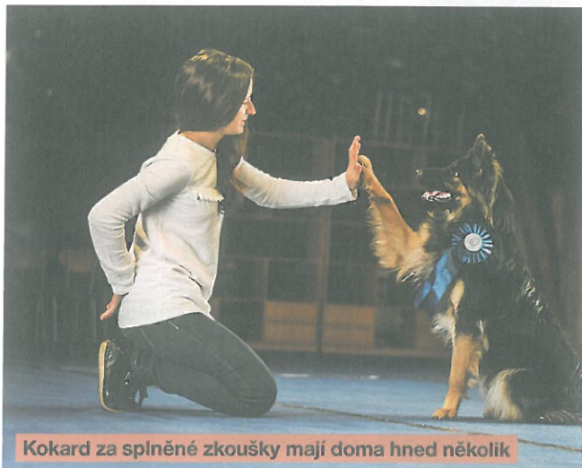
Kokard za splněné zkoušky mají doma hned několik

Safirka mi dodnes plní všechny mé sny. Ukázala mi, jak chodský pes dokáže být velmi všestranný – úspěšně jsme splnily dogdancingový titul Master of Dogdancing prvního stupně v necelém jejím roce a půl a pokračovaly se zkouškami druhého stupně. Také jsme splnily pár základních zkoušek ze sportovní kynologie, aktivně závodíme v agility, vyzkoušely jsme si závody v dogfrisbee a objezdily spoustu výstav,