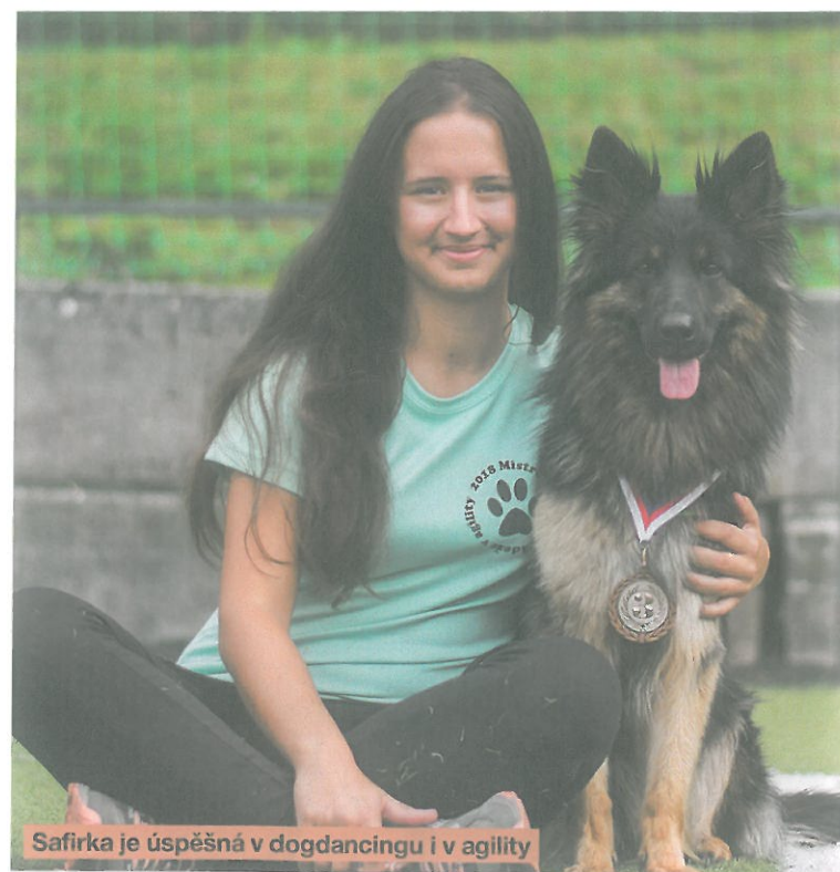
Safirka je úspěšná v dogdancingu i v agility

z Gipova – podomácku Safirky. Zpočátku jsme se báli, jak štěňátko přijme Blackie, naše kříženko labradora. Po celou dobu byla jedináček a užívala si jen naši pozornost. Byla vždy dost majetnická na žrádlo, na hračky, batohy. Proto jsme je tedy první měsíce dost hlídali, nenechávali moc volně ležet misky, hračky a další různé věci, kvůli kterým by mohl vzniknout nepříjemný spor. Avšak netrvalo to dlouho a holky se staly skvělými parťačkami. Čas od času si Blackie s malou Safirkou dokonce i pohrála, ale stále jí vždy ráda připomněla, že ona je ta šéfká domu. Holky na sobě nejsou závislé, ale vždy jsou rády, když jsou spolu.