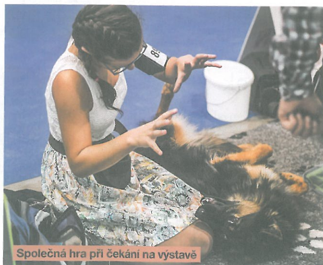
Společná hra při čekání na výstavě