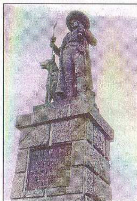
Socha Choda na výšině Hrádek u Domažlic