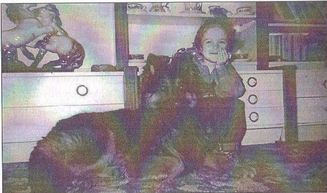
V bytě s dítětem jsou oba spokojeni

Co se týče samotného výcviku, bere jej sportovně. Vždyť překážky jakéhokoliv druhu jsou pro něho příjemným zpestřením. Rovněž tak stopování ho přivádí do soustředěného stavu, což je dokladem jeho vynikajícího čichu. Problémová u něho není ani obrana a poslušnost, při níž rozumí každému slovu svého pána. Aby neztratil zájem o výcvik, je nutné k němu přistupovat nápaditě a s plným porozuměním jeho vnímavé a chápavé povaze. S přípravou ke služebnímu využití se postupně přichází od 6. měsíce věku, ale s plným výcvikem až od jednoho roku. Jízda autem, z něhož soustředěně pozoruje okolí, je pro něho pravým požitekem.