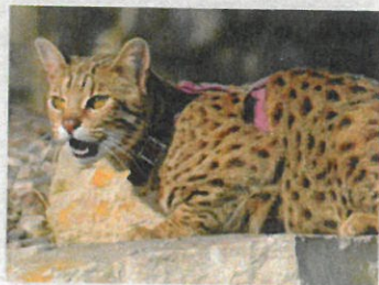
Asijská leopardí kočka - ALC