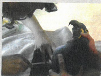
Značení papoušků patřících do CITES