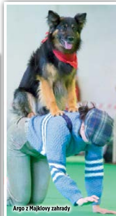
Argo z Majklovy zahrady